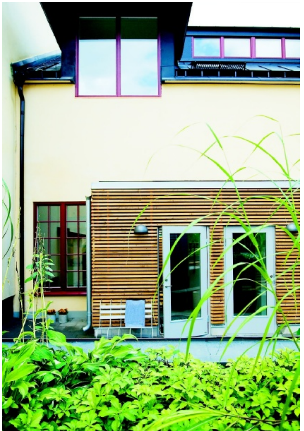
Sprillans nytt "stadshus" på Södermalm – Lilla Tullens Townhouse.