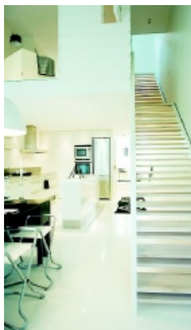
Interiör från Skanska nya townhouse på Söder.