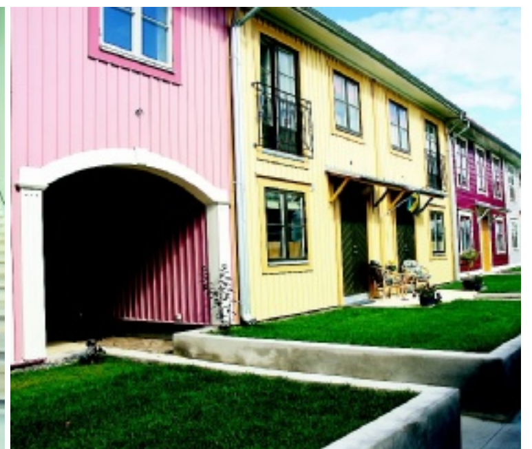
Townhousen i det nybyggda kvarteret Kassören i centrala Mariefred blev nyligen klara för inflyttning.